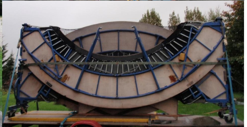
4,97 M de long